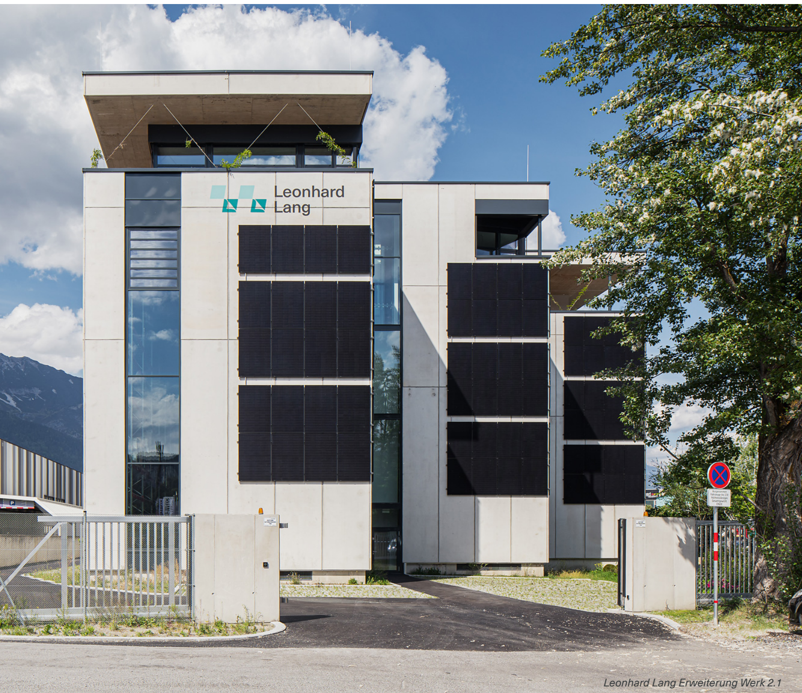
Leonhard Lang Erweiterung Werk 2.1

Mit der Entwicklung und Produktion von EKG-Elektroden und weiteren medizintechnischen Produkten sowie dem Sondermaschinenbau steht höchste Qualität für die Leonhard Lang GmbH an erster Stelle — unterstützt durch kontinuierliche Forschung und Entwicklung sowie Prozessmanagement auf höchstem Niveau.